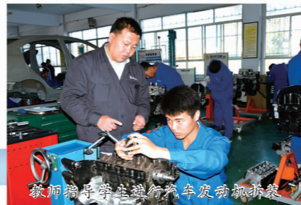
教师指导学生进行汽车发动机拆装