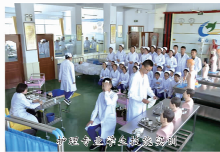
护理专业学生技能实训

甘肃省高台县职业中等专业学校创办于1988年,占地面积308亩,建筑面积40300平方米。现有教职工185人,开设汽车运用与维修、电子电工、老年护理、农村经济综合管理、学前教育等长线专业12个。2000年6月,被教育部评估确定为首批“国家级重点职业学校”。2017年6月,被甘肃省教育厅确定为首批创建的“省级中等职业教育改革发展示范学校”。