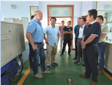
德国赛德尔基金会 莱贝格先生来校考察