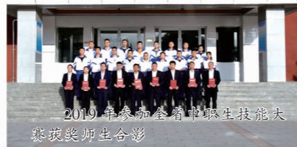
2019年参加全省中职技能大赛 获奖师生合影