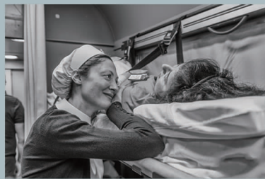
作品名称:《我的灵魂伴侣》 奖项:一般黑白组第二名