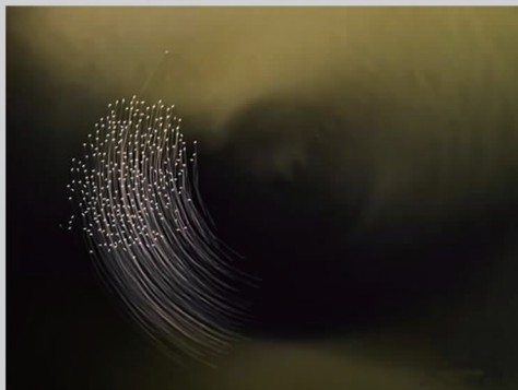
作品名称:《漩涡》 奖项:一般彩色组第三名