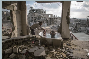
作品名称:《瓦砾间的浴缸》 奖项:希望组第二名