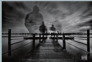
作品名称:《漫长的路》 奖项:希望组第三名