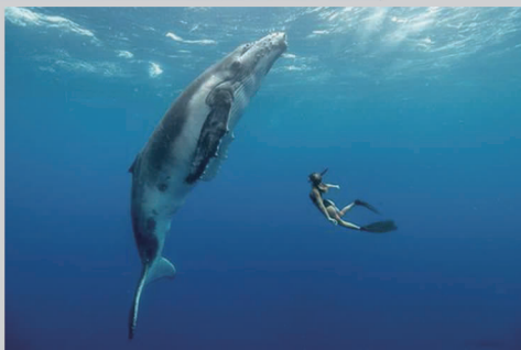
作品名称:《一个奇妙的相遇》 奖项:一般彩色组第二名