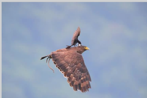
作品名称:《以小欺大》 奖项:一般彩色组第一名

哈姆丹国际摄影奖是迪拜王储哈姆丹发起的一个国际性摄影比赛。大赛每年都会会有一个不同的主题,今年的主题是“希望”。本次比赛吸引了来自 121 个国家的 19000 多名摄影爱好者参加,获奖摄影师们可以拿到丰厚的奖励,其中总冠军可获得 12 万美元的奖励。当然,对于热爱摄影的人来说,能透过镜头去发现世界,让人们看见这世界上美好与希望,才是最大的意义。