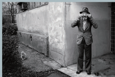
作品名称:《老人和猫》 奖项:一般黑白组第一名