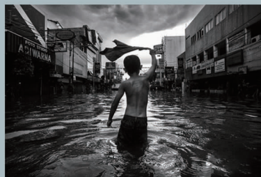
作品名称:《暴风雨天》 奖项:希望组第一名