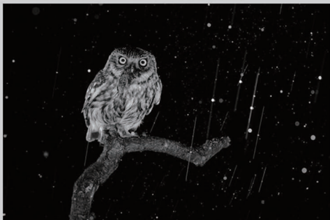
作品名称:《雨夜中的猫头鹰》 奖项:一般黑白组第三名