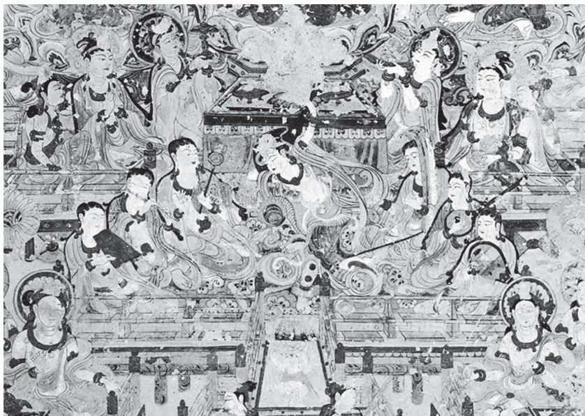
莫高窟第 112 窟 乐舞图