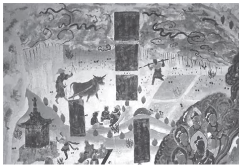
《雨中耕作图》 莫高窟第23窟 盛唐

要时给大人搭把手。因此，壁画中呈现出的还有中国普通劳动人民实实在在的家庭教育，父母带着孩子一起参与劳动，这就是最实际的家庭教育。