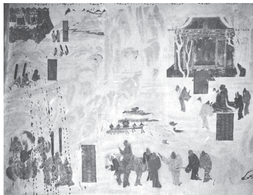
张骞出使西域图 莫高窟第323窟 初唐

文化，“集建筑艺术、彩塑艺术、壁画艺术、佛教文化于一身，历史底蕴雄浑厚重，文化内涵博大精深，艺术形象美轮美奂”。敦煌文化灿烂的奥秘，就在于其彰显了不同文化的汇聚和交融。