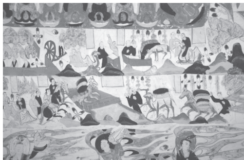
丝路贸易图 莫高窟第296窟北披 北周

敦煌地区多民族、多文化长期并存,社会生活的各方面都体现出鲜明的地域文化特点。从生产生活、民俗节庆、婚丧嫁娶、喜怒哀乐等人生百态,到建筑、服饰、用具、工具等具有不同时代烙印的物质造型,敦煌壁画构成敦煌中古时期活灵活现的社会文化发展演变的图谱,这也使其不仅