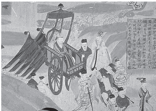
莫高窟第148窟 独辘四驾马车

骆驼是沙漠地区重要的交通运输工具，有着“沙漠之舟”的美誉。在莫高窟第61窟《五台山图》所绘的