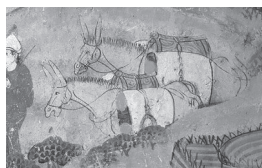
莫高窟第45窟 旅途中的驴