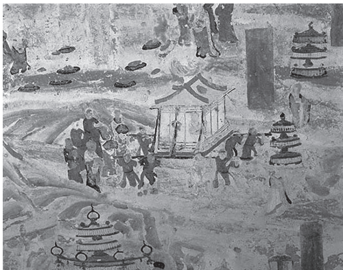
莫高窟第85窟 八抬屋式肩舆

舆轿是一种独特的交通工具,由于全部使用人力抬杠,故又称“肩舆”。最初是为适应不便车马行走的山道而产生的,后来更多的是乘坐者身份的象征。敦煌壁画中绘有各种肩舆,四人、六人、八人,不同人数代表不同等级。人们常说“八抬大轿”,八人抬就是最高的规格。