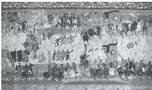
莫高窟第156窟《张议潮统军出行图》 (局部)

在古代社会，马是最重要的军事资源，也是重要的交通工具。在敦煌壁画中，随处可见马的身影，最著名的应属莫高窟第156窟《张议潮