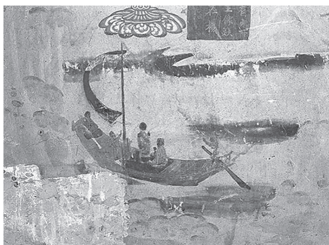
莫高窟第323窟 扬帆前进

敦煌虽然地处戈壁沙漠,河流很少,但不妨碍古代画师发挥想象,绘出各种水上交通的画面。敦煌壁画里保存了大量的古代舟船图像,船的款式由简入繁,多达十余种。莫高窟第323窟南北两壁的壁画中,绘有大大小小的木板船和帆船十多只,划桨、摇橹、张帆、拉纤等各类驱动方式都有。