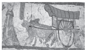
莫高窟第62窟 侍女牛车