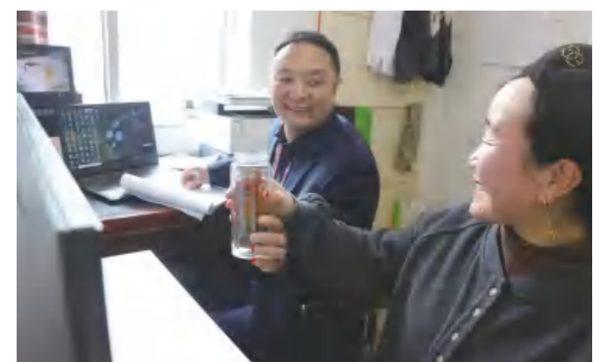
夫妻俩把彼此的关心都藏在细节里