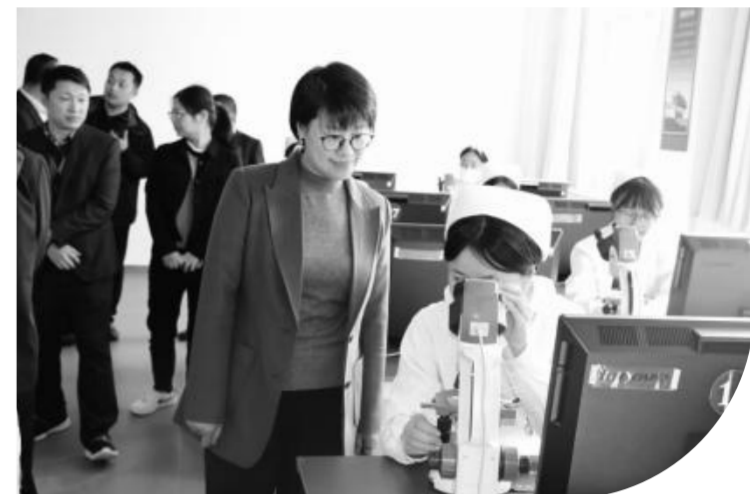
武威市凉州区职业中等专业学校与江苏省太仓中等专业学校开展校级教研交流

今年以来,武威市凉州区持续借鉴东西部教育合作交流成功经验,按照“科研引领、两地合作、协同创新”的工作思路,先后与江苏省南菁高级中学、江苏省太仓中等专业学校、深圳高级中学等多所学校,签署交流合作框架协议,以多种方式开展教育教学交流活动,不断探索并实践东西部教育交流合作的优秀途径,让教育拥有了别样温度、智慧和深度。