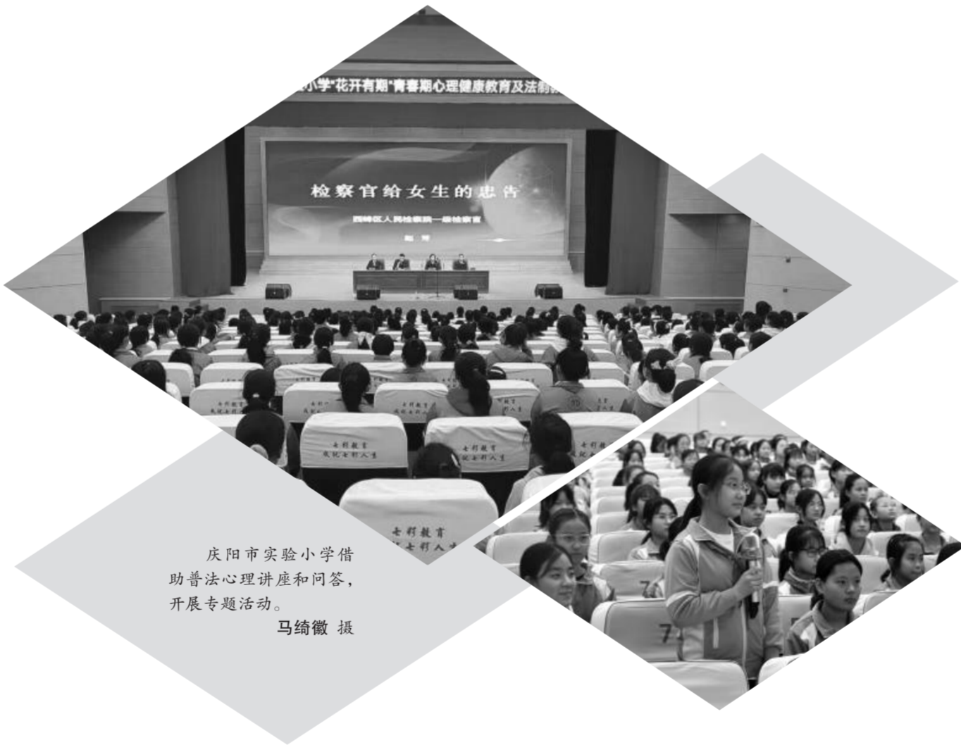
庆阳市实验小学借助普法心理讲座和问答,开展专题活动。

总而言之,想要真正贯彻落实《条例》,需要多管齐下,更需要全民参与,《条例》可以是底气和保障,但要真正起到积极高效的保护作用,还是需要团结一切可以团结的力量,从网络开发、网络传播、网络监管三个层面团结家、校、社会三个方面的力量,众志成城,共同守护未成年人网络世界的精神净土。