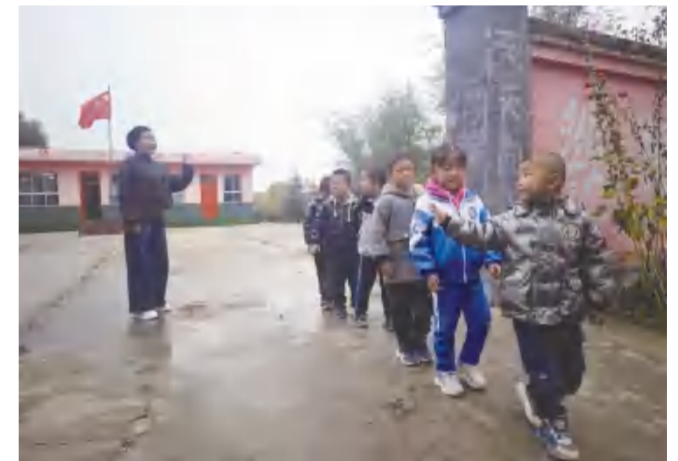
放学时,学生们跟“老师妈妈”说再见。