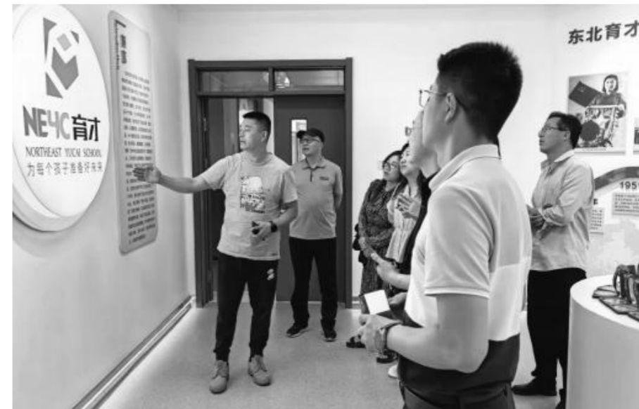
静宁一中教师在东北育才中学观摩交流

足文章,打造高效课堂,引导学生深度学习,不折不扣提升学校教育教学质量。”静宁一中校长周申虎说。