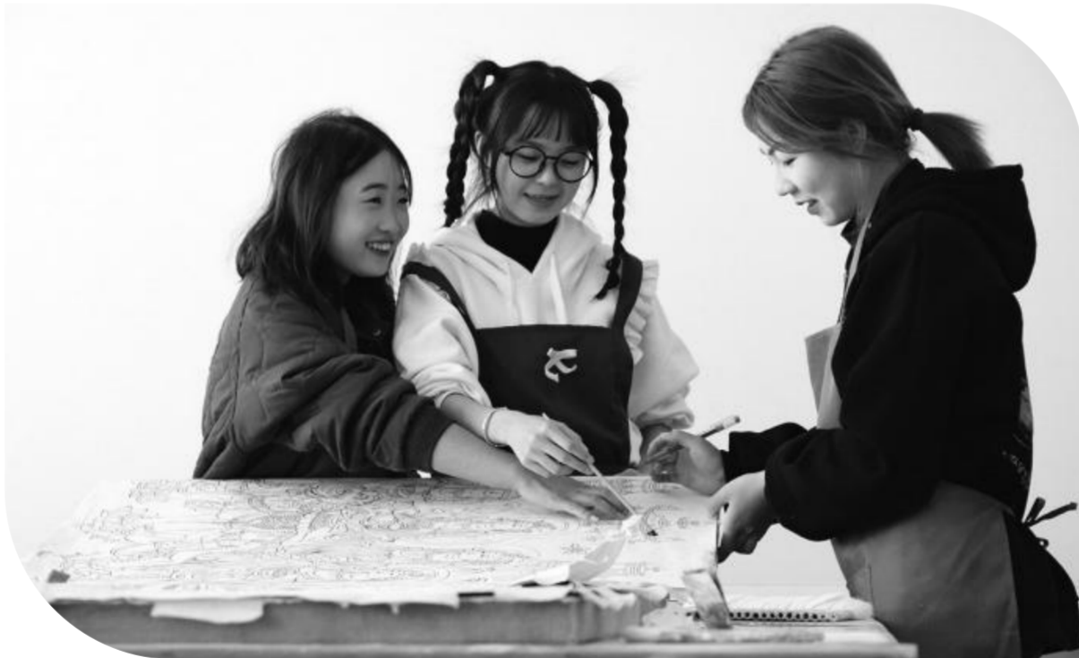
石窟寺保护技术专业的学生们讨论临摹佛像的构造

与此同时,该校马克思主义学院积极探索将中华优秀传统文化有机融入思政课,依托璀璨的中华文明,立足甘肃历史文化,通过剪纸、书法、绘画等方式,在“润物细无声”中实现育人实效性;通过整合优化课内课外、校内校外鲜活的教学资源,打造“行走的思政课”《寻迹》系列课程,引导学生在实践中认识社会、锤炼意志、积累经验,最大限度调动学习积极性与主动性,进一步坚定文化自信,努力成为中华优秀传统文化的传承者、弘扬者、创新者。