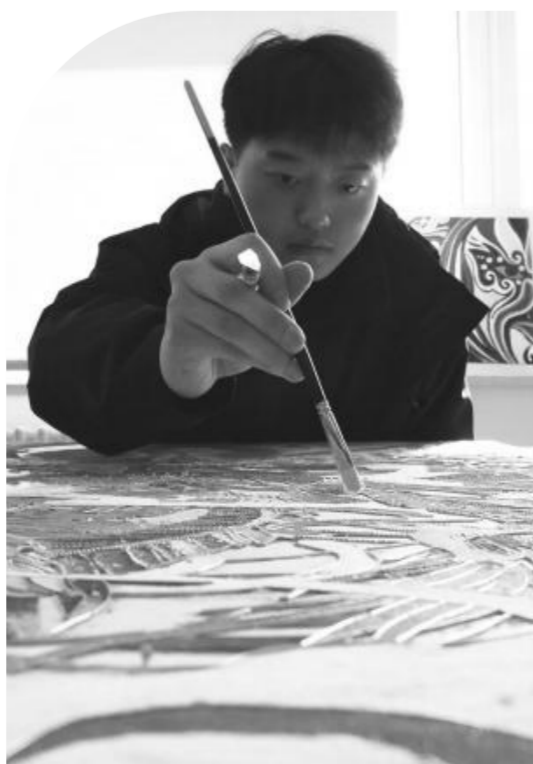
一名学生正在小心翼翼地制作掐丝珐琅作品