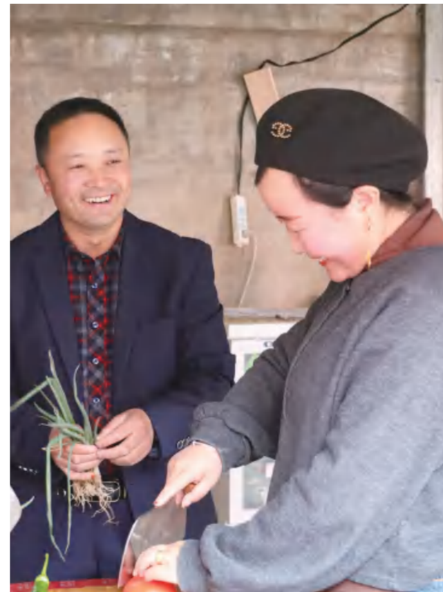
夫妻二人有说有笑地做晚餐