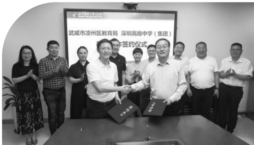
武威市凉州区教育局赴深圳与深圳高级中学(集团)签订中小学教育合作战略性框架协议