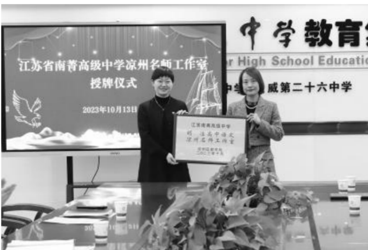
江苏省南菁高级中学凉州名师工作室授牌