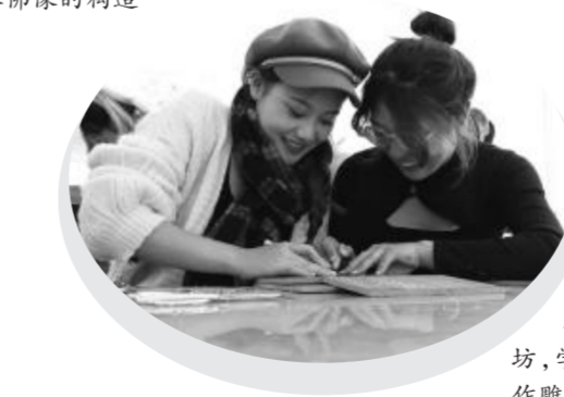
在版画工坊,学生互相合作雕刻图案