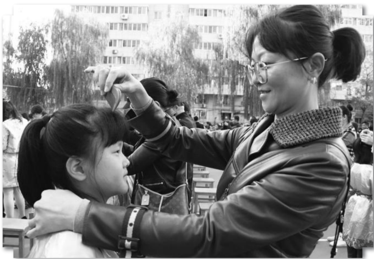
“成童礼”是一种传统礼仪,目的是倡导子女知晓父母养育之恩,学会孝敬父母。10月20日,兰州市七里河区七里河小学举行了“习礼、知爱、感恩”的立志成童礼。图为三年级学生通过盥洗礼、护蛋仪式、拜孔子、行梳礼等表达对父母和老师的感恩。

厨艺大赛也是广受师生家长欢迎的一项活动。金昌各学校通过开展“我是厨房小帮手”、秀美食厨艺、云端厨艺大赛等活动,既丰富了学生课余生活,又养成了学生勤做家务的好习惯。学生通过参加劳动体验课,逐渐成为懂劳动、会劳动、爱劳动的新时代新人。