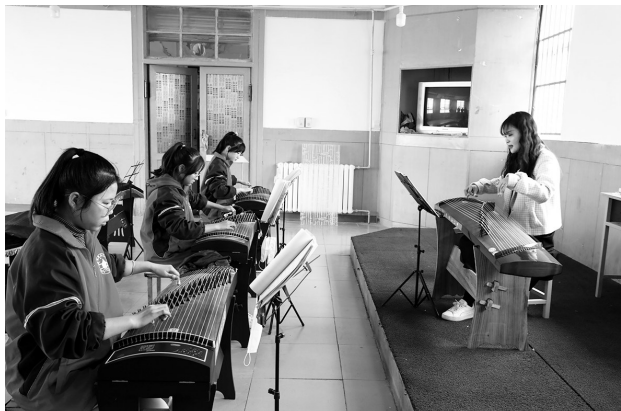
甘谷县第三中学古筝专业班学生在琴房训练

共享资源增强发展动力。天水的红色、自然、工农业等资源禀赋发育饱满,市域内有旅游景区和文化场馆89个。我们要充分发挥本地资源优势,充分挖掘校外资源的利用价值,协调建立管理单位和学校共建共享共创的有效机制,实现资源的双向互动,鼓励学校组织学生开展研学旅行等社会实践活动,有效破解校内创新实践资源短缺的难题,培养学生的综合素养。同时,引进外地优质资源。为贯彻落实教育部等九部委《“十四五”县域普通高中发展提升行动计划》精神,江苏省和甘肃省教育厅开展合作共建推动县中发展提升创新行动,创新江苏和甘肃两省县中合作共建、协同发展模式,推动县域普通高中办学水平整体提升。天水市第三中学作为全市第一批苏甘两省合作共建学校,和海门中学建立合作共建帮扶关系,海门中学将从办学条件改善、教师培养培训、管理机制改进、课堂教学改革、教科研活动开展等方面天水市第三中学。学校抓住这次机遇,深化合作共建,吸收先进办学理念和教学经验,努力破解学校办学、交流中的实际困难及问题,加大政策支持力度,确保共建行动取得实效。我们还将结合县中振兴工程,加强各学校建设,寻求新的合作交流契机,采用“请进来,走出去”的方式,学习优