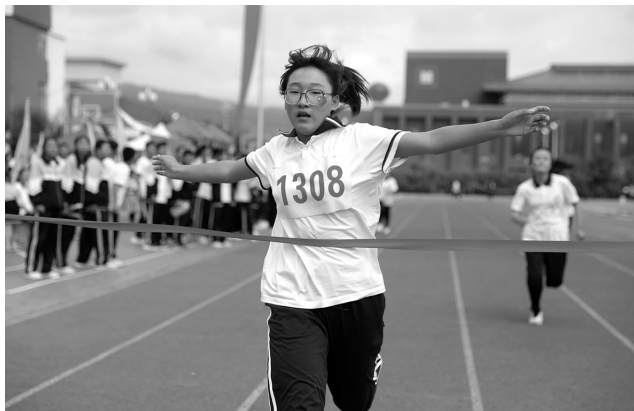
天水市第六届中学生运动会田径比赛高中组选手终点冲刺

科学教育、人文教育资源,拓展科学实践活动,激发学生科学探究兴趣,促进学生自主、合作和探究学习,培养学生的科学探究精神和实践能力。