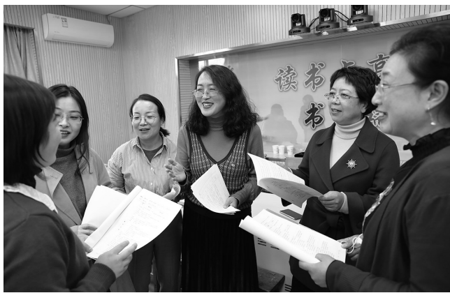
参加天水市高中思政课优质课比赛的评委和教师赛后交流

学校发展突出特色。各县区要围绕普通高中育人方式和评价方式改革的要求,全力推动普通高中错位发展和多样化发展,切实扭转普通高中“同质化”状况,按照生源、地域、学校文化积淀等方面的不同情况,引导普通高中由分层教育向分类教育转变,建设一批具有科技、人文、外语、体育、艺术等方面特色的普通高中,鼓励公办民办高中取长补短,多样化发展,坚持文化课和术科并重,不断优化术科招生比例,拓展专业设置空间,让学生的专业特长得到充分发展。鼓励高中学校开发分层分类、丰富多样的选修课程,有条件的学校开设小语种,形成体现学校办学特色的课程系列,满足学生多样化学习和发展需求。学校要结合自身实际和资源禀赋,制定特色鲜明的育人工作方案,完善特色课程体系,丰富特色办学资源,着力发展学生的核心素养,促进学生全面发展。