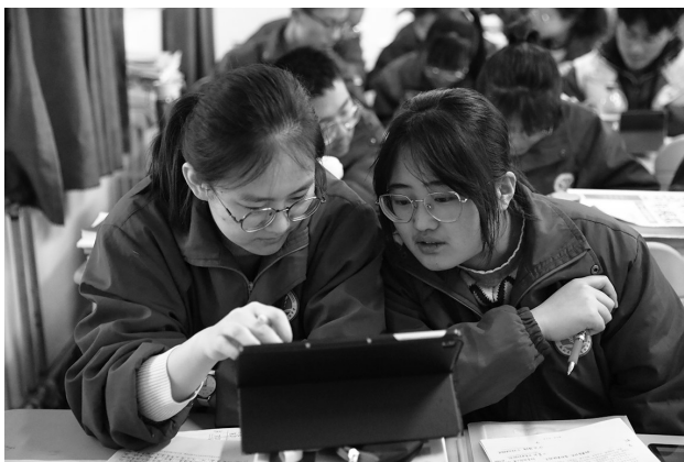
武山县第一中学的学生齐上成都七中直播课