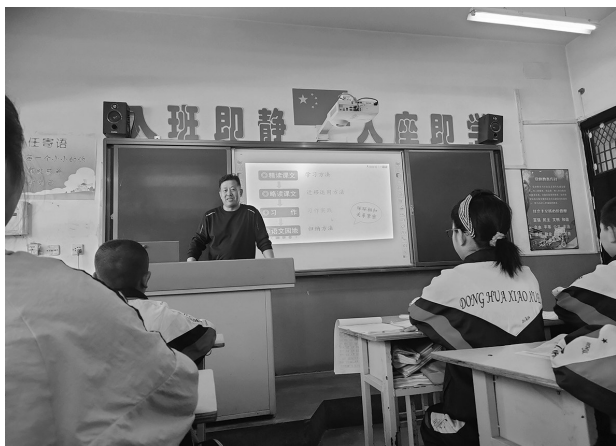
给高年级语文组教师上示范课

人”的课程理念及“15362机制,让传统文化在我校生根”的典型做法,确立了构建中华优秀传统文化教育的语文课改方向,积极编写了一至六年级12册《中华优秀传统文化》,由吉林教育出版社出版,全国发行。