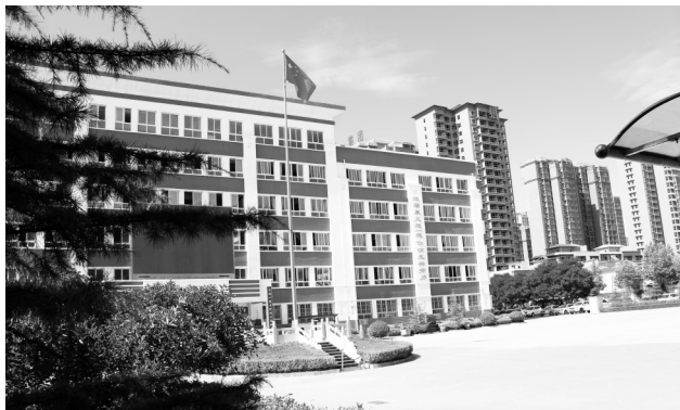
甘谷县第六中学高中部校园一角

教研教改探索新路。加快督导、教研、基教“三轮”驱动,发挥市、县教研部门和高中中心教研组牵总作用,进一步建立和完善督导、教研评价考核办法,在高中学校建立一批名师工作室,鼓励特级教师、学科带头人等名师带头开展新高考前瞻性研究,教研主题关注义务教育、基层学校、薄弱学科、弱势群体等关键环节和重点部位,推行线上跨校区大单元集体备课和教研活动,重视强化初、高中教育衔接,帮助高中学校找差距、补短板,提升教研能力。积极探索高中学校联盟办学,统筹高中学校间教师配备,引导示范性高中从理念转变、课程建设、干部提升、师资培训入手,加强师徒结对、联研联训、综合培训、跟岗实践,增强自我积累和自我发展的能力。充分发挥特级教师、陇原名师、学科带头人等名师团队的示范引领功能,在全市推行线上跨校区大单元集体备课和教研活动,有效破解县中学科薄弱的问题。发挥学科骨干的引领作用,引导高中学校为学科骨干赋权赋能,促进学科交融和整体构建。