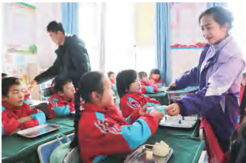
◀12月25日,大庄小学的学生时隔一周回到了校园。图为老师为学生分发热腾腾的营养餐