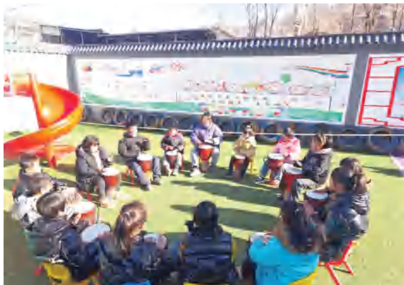
陶家小学临时教学点里,师生用现有设备开展美育活动。