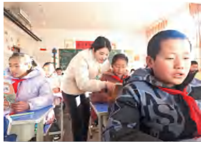
12月25日,阳山希望小学的师生重返校园,教师认真给学生辅导。