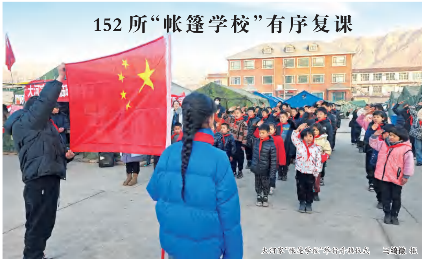
大河家“帐篷学校”举行升旗仪式

本报讯(记者 马绮徽 杨争荣)12月25日8点30分,积石山县大河家镇安置点内的大河家“帐篷学校”举行升旗仪式。41名学生和10名教师齐声高唱国歌,少先队员行队礼,教师行注目礼,共同看着鲜艳的五星红旗在帐篷外飘扬。