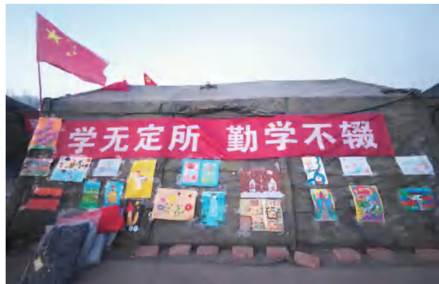
大河家“帐篷学校”外,学生用自己的手工和绘画作品布置自己的“临时学校”。