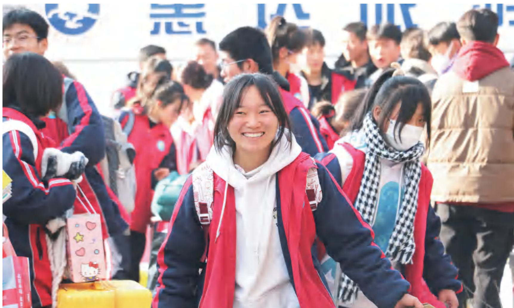
12月28日,积石山县800余名高三学子搬进“新家”临夏州职业技术学校,他们将于12月30日前,分三批入住,异地复课完成本学期学习生活。