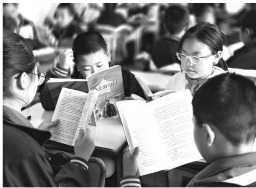
陇西 县文峰小 学学生集 体阅读

展播活动。在舒缓优美的背景音乐中,孩子们诵读习近平总书记引用过的名言典故,阐释一个个典故的深刻内涵,争做有理想、有本领、有担当的新时代接班人。