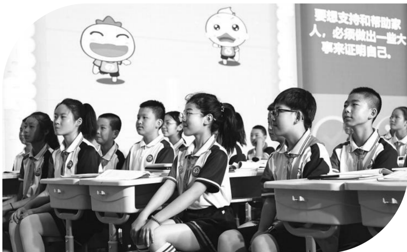
武威新城区第一小学三年级(6)班的孩子们在上公开课

近年来,武威新城区第一小学依托智慧校园建设,深入聚焦课堂教学的改革,以教师专业成长引领教育教学发展。“尤其是‘双减’实施以来,我们更加深入地关注如何让学生真实积极地持续地发生,通过三步互助教学的推进,实现从学会到会学的转变。”蓝聚林说,“我们深入关注学习思维是如何推进的,教与学思维发展的互动机制又是怎样的?以此为出发点,‘AI课堂’更加高效直观地了解到课堂教学过程中的