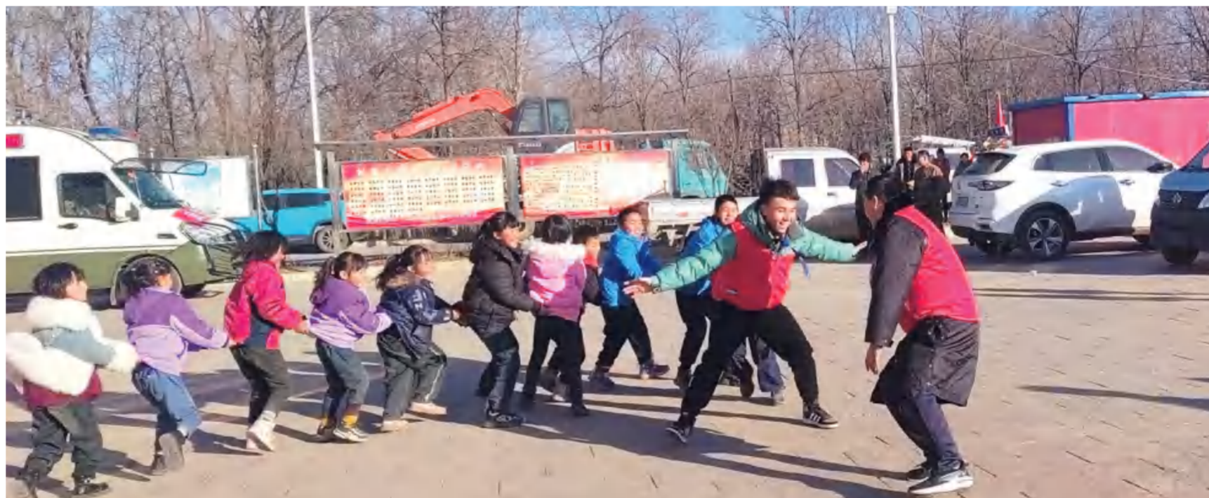
自“帐篷学校”开课后,教师们因地制宜为学生设计丰富的活动,调动他们的情绪。