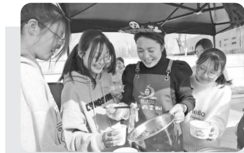
“定西宽粉”进高校活动启动当日学生在品尝麻辣味宽粉