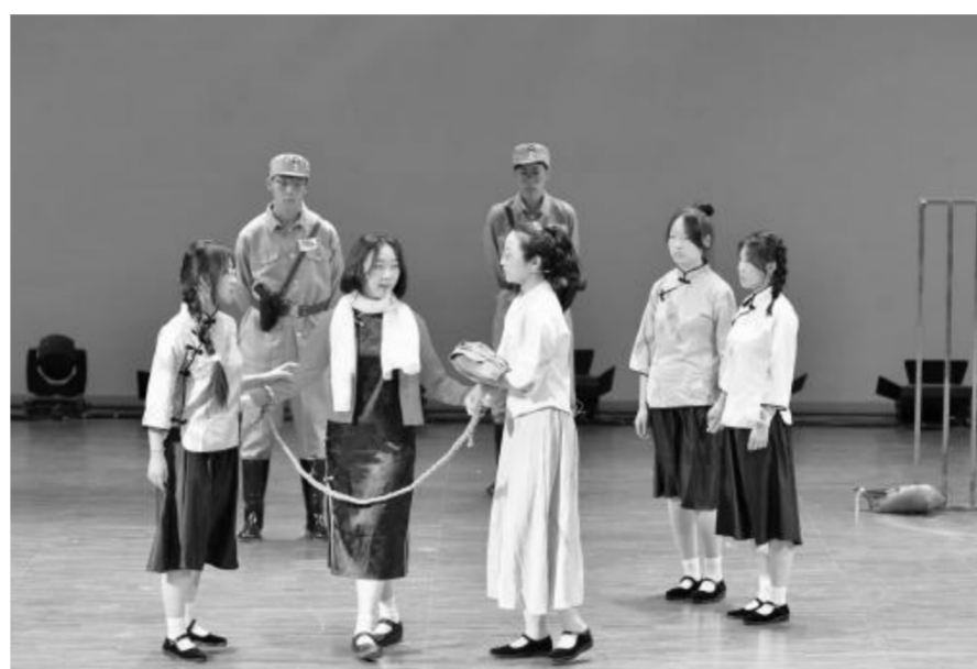
嘉峪关市酒钢三中课本剧《红岩》汇报演出

创形式,优化教学提实效。严格落实国家课程计划,指导各中小学开齐开足上好思政课程,思政课程的主阵地主渠道作用得到充分发挥。积极引导广大教师将思政内容融入学科教学,承担好育人责任,守好一段渠,种好责任田。先后开展了全市教育系统“新时代·新思想”理论宣讲大赛、“大思政课”情景剧教学等一系列教学活动,引导各学校充分利用重大节庆日、重要纪念日,积极开展各种形式的主题教育和实践活动,积极探索创新思政教育模式,提升了思政教育的吸引力和感染力。各学校立足校情、生情,积极打造各自的思政教育品牌,教育引导广大青少年厚植爱国情怀,弘扬中华优秀传统文化。市酒钢三中每年举办“传承红色基因 赓续革命精神”情景剧展演活动,引导同学们挖掘课本中的红色故事,在自编、自导、自演的沉浸式演