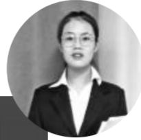
韩芸霞分享《平凡的世界》

塔拉·韦斯特弗来自一个极少有人能想象的家庭。塔拉是家中的第七个孩子,也是最小的孩子。她的童年由垃圾场的废铜烂铁铸成,那里没有读书声,只有起重机的轰鸣。不上学,不就医,父亲不允许她拥有自己的声音,她的意志是他眼中的恶魔。直到她逃离大山,打开另一个世界。那是教育给她的新世界,哈佛大学,剑桥大学,哲学硕士,历史博士……她的生命有了无限的可能。刘捷老师在分享中提到:“阅读方能阅己,阅读方能阅人,阅读方能阅世。”你当像鸟飞往你的山,愿你我像本书作者一样勇敢、无畏,最终寻见属于自己的山,并站上高山之巅。这本书让我们体会到了一种昂扬向上的力量。一个17岁未曾踏入教室的大山女孩,却戴上了一顶学历的高帽,书中传递着的那种不妥协、不放弃和期待的思想鼓舞人心。