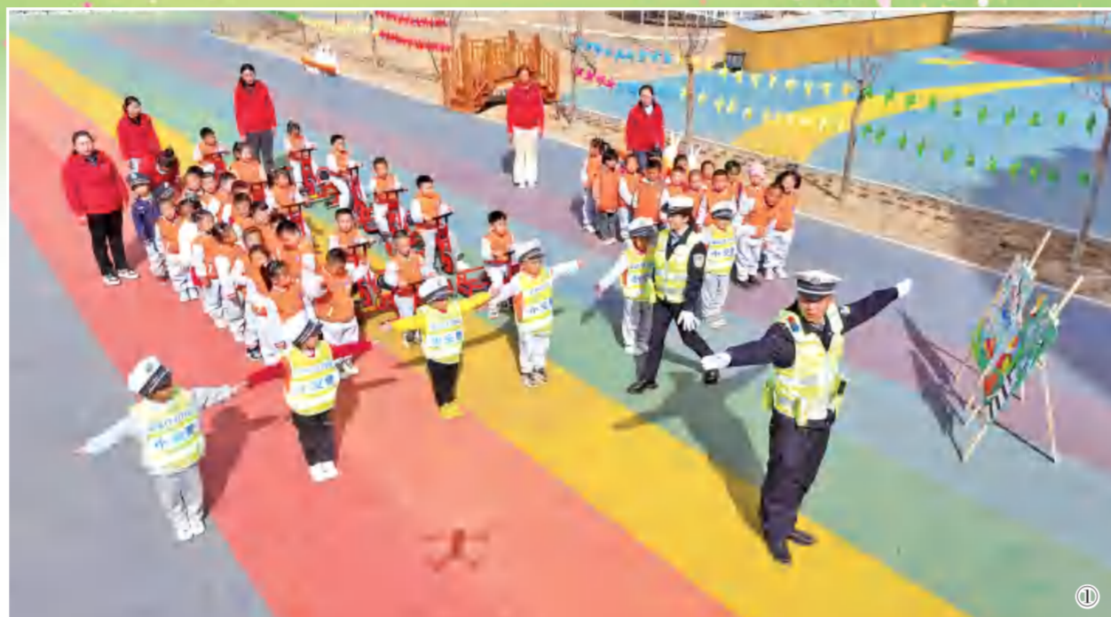
① 3月25日,临泽公安局交警大队法治宣传民警深入辖区学校开展交通安全宣传进校园系列活动,点亮学生“平安上学路”。

安全无小事,孩子的安全更是牵动着每一个家庭的心。为切实增强孩子安全防范意识,提高自救自护应变能力,本期特别策划,向广大师生、家长普及安全知识,守护孩子安全健康成长。