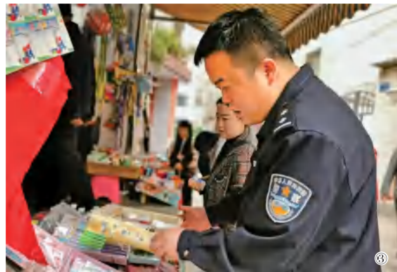
③ 3月26日,陇南市武都区莲湖小学联合区综合执法局、社区、派出所等部门,对学校及周边环境进行了综合排查整治行动,对校园欺凌做了走访调查和实地巡查。图为排查小组对校园周边的重点场所进行消防设备、人员健康状况、食品安全等情况检查。