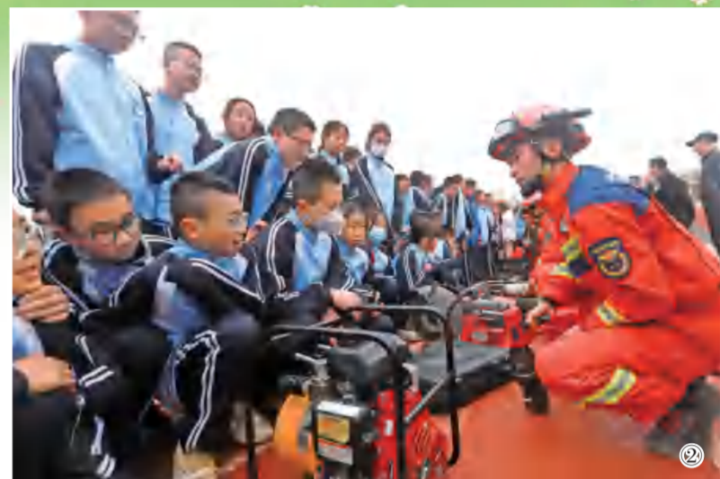
② 3月26日,平凉市崆峒区消防救援大队消防员为平凉市第四中学学生讲解地震消防救援装备操作常识,增强师生的消防安全防范意识,积极引导师生掌握避险自救技能,提高应对突发事件能力。