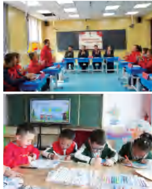
▲山丹县幼儿园开展“国家安全教育日”系列活动