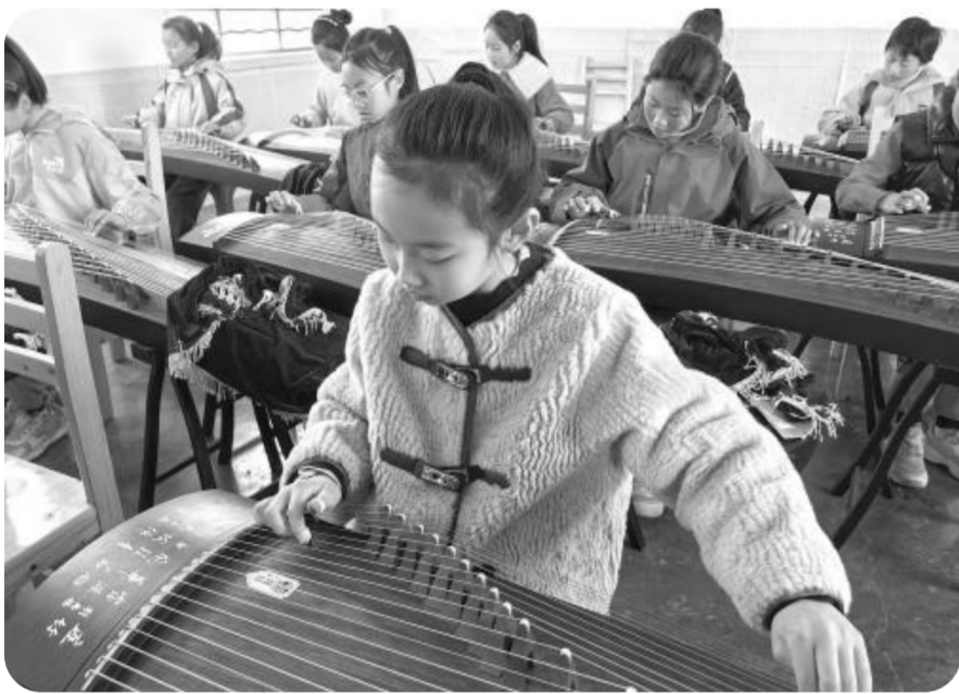
庄浪县水洛学区徐碾小学开设了丰富多彩的社团课程

2023年以来,庄浪县教育局紧扣制约教育发展的突出问题,创新思维,推出了加强教育管理的“十条禁令”,从作业管理、课堂教学等多个维度,引导师生走出“唯分数、唯考试”误区,将重心转向立德树人的教育本源,重塑学校教育生态,教育发展呈现新气象。