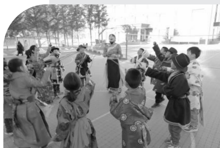
▲ 走教教师带领孩子们感受音乐艺术魅力 杜国利 摄 ▲ 孩子们在心理课堂上快乐地与老师做同心击鼓游戏 杜国利 摄