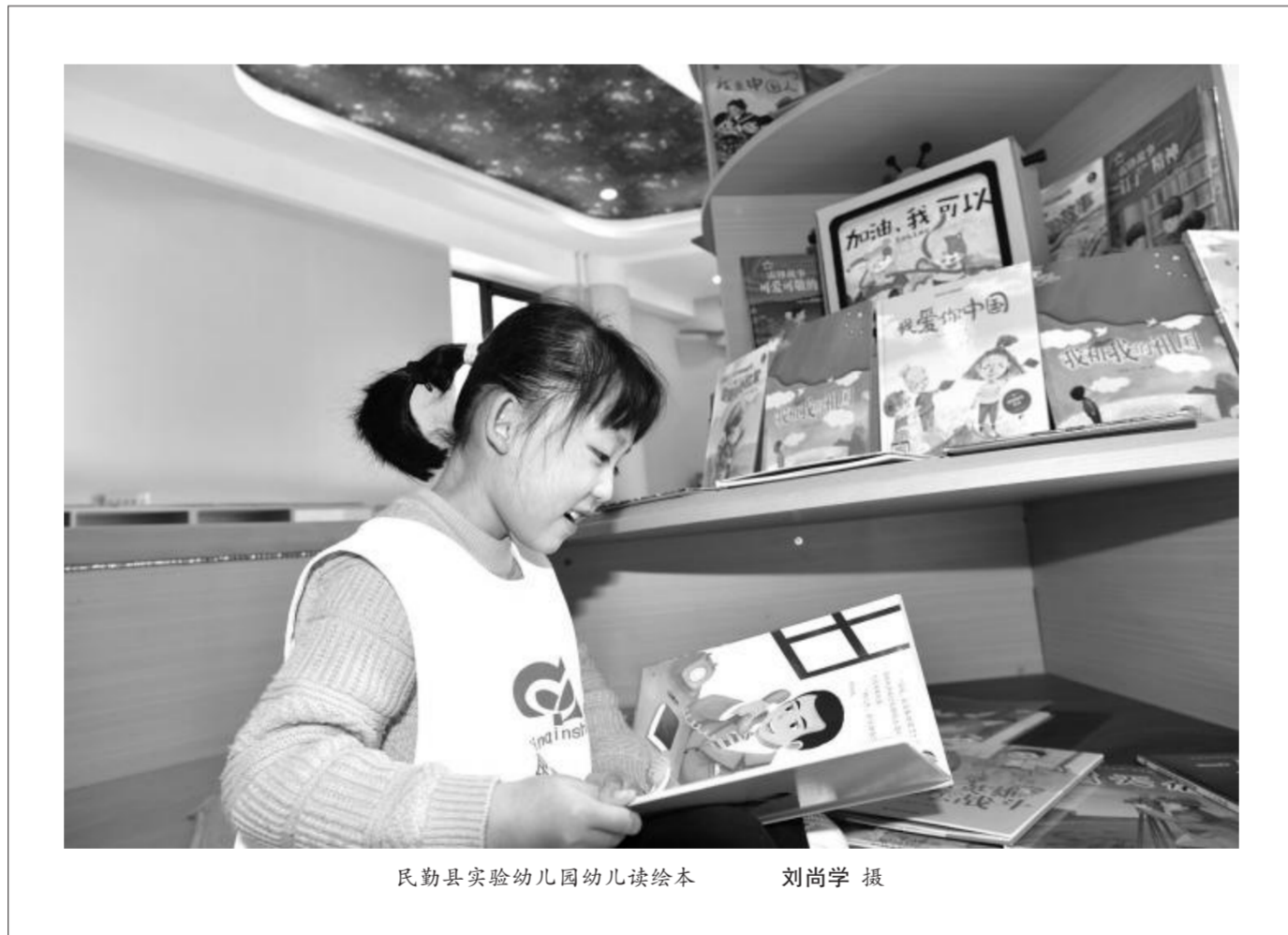
民勤县实验幼儿园幼儿读绘本

在一线教育工作中,难免会遇到难题,比如学生学习困难、学生的叛逆、家长的不理解等等,彼时内心难免焦躁委屈。书籍可以使我迅速平复心情,同时收获教育先贤们的心血智慧,感悟教育千里跋涉的真谛。