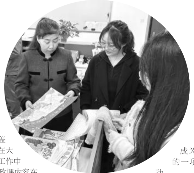
工作室教师对学生“手绘全国两会”大赛作品进行评选

每年的全国两会对于国家和人民来说都具有极其重要的意义。为引导学生学习两会知识,贯彻两会精神,了解中国国情,增强民族自信,每年两会之后,工作室都会协同兰州一中政治教研组组织发起“手绘全国两会”手抄报比赛活动。此项活动潜移默化地将爱国情、强国志、报国行的思想政治教育渗透其中,有效引领了青少年学生以两会精神为指引,振奋精神、刻苦学习、爱党爱国、努力成为立志、担大任、明大德、成大才的时代新人;“手绘全国两会”大赛活动截至目前已连续举办三届,活动效果良好,已