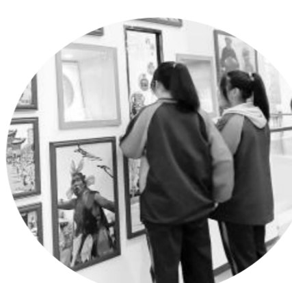
学生在定西市城市展览馆驻足观看新时代十年家乡变化

学们说道:“作为一个普通的医务工作者,我只是履行了自己的职责,但从武汉到兰州,再到家乡,人们却给了医疗队员们那么多鲜花和荣誉,这一切让我和我的‘战友’们感动不已。”她勉励同学们,要像习近平总书记给北京大学援鄂医疗队全体“90后”党员的回信中写的一样,“让青春在党和人民最需要的地方绽放绚丽之花”。